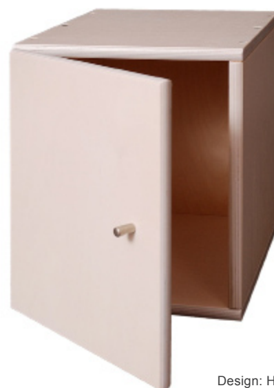
Design: Hans Klarskov