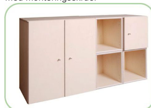
klarskov-Kombi Reol 1/4 kan kombineres med Kombi Reol 1/1 og 1/2