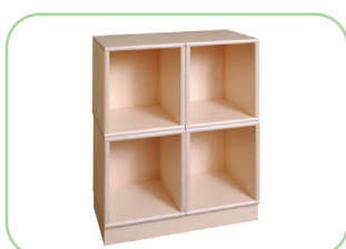
klarskov-Kombi Reol 1/4 kan skrues sammen vandret og lodret med monteringskruser