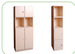
klarskov-Kombi Reol 1/4 kan kombineres til et højt skab