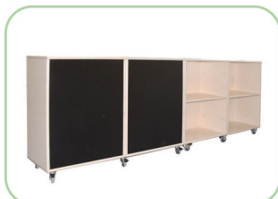
klarskov-Kombi Reol kan kombineres og beklædes med forskellige bagbeklædninger